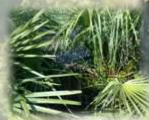
Margallons de pujada a la Creu del Cardenal

moltes altres que s'assenten en funció de les seues necessitats i de les que l'entorn li ofereix. Aquestes hi destaquen a la zona de l'Hortet i a les fondalades dels barrancs .