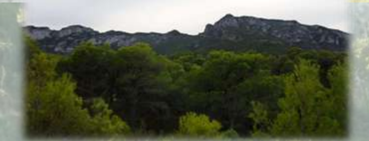
La Pineda dels Collaets, al fons cims del Cavall, Creu i Cingle Blanc

Per un lloc trobem zones amb una rica massa forestal com son les pinedes del barranc de Canet , els Collaets o de les llomes del barranc de Corbella . Per altra banda en grups aïllats trobem freixers de flor , marfulls , arboços o carrasques , a diferents llocs de la serra com per exemple, la senda d'accés al Cingle Blanc .