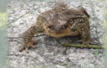
Gripau (conegut com Sandokan)

A dins de la família dels rèptils i amfibis molt habituals en aquest paratge tot i que, per desgracia, al igual que senglars i rosegadors, no gaudeixen de la simpatia d'alguns dels visitants y residents de la zona, on hi destaquen les serps llises meridionals ( Coronella girondinca ), diferents espècies de sargantana i llangardaix de nit , o el conegut com a Fardatxo ( Lancerta lepida ). Els amfibis tenen com a màxims representants les granotes comuns i els gripaus ( bufo bufo ) que s'aprofiten de fonts i mallades.